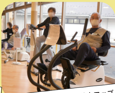
マシントレーニングで筋力アップ