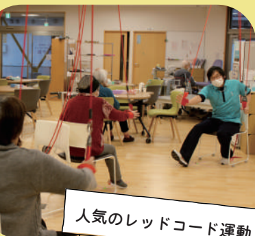
人気のレッドコード運動