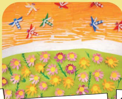
ハマる！巨大壁画製作