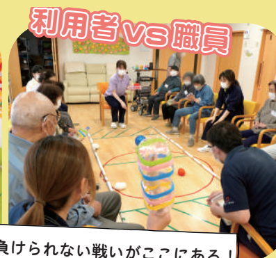
利用者vs職員 負けられない戦いがここにある！